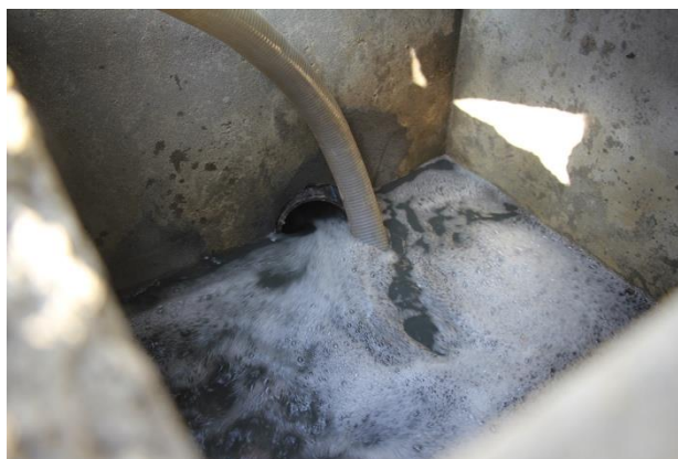
Bac de sortie avec pompe active