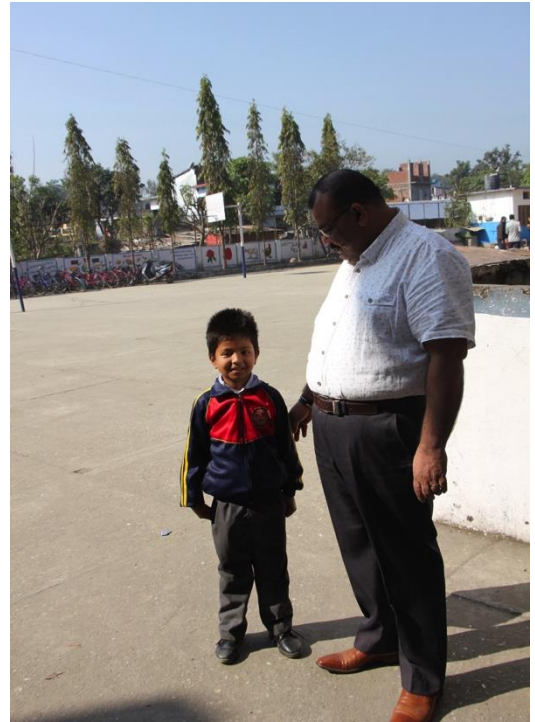
Uttar se reconnaîtrait-il dans ce petit garçon ?...