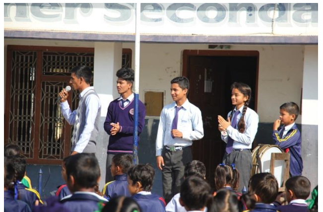
Cérémonie de remise de prix

Importance du ramassage scolaire Pour les enfants des campagnes alentours. Uttar est actuellement en lien avec « les amis de CH » pour financer l'achat d'un bus d'occasion.