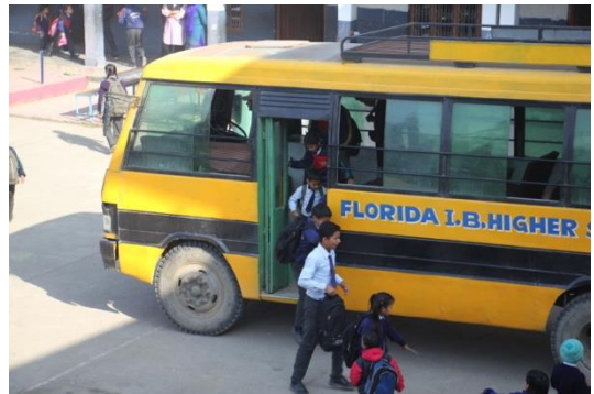
Beaucoup de discipline

Importance du ramassage scolaire Pour les enfants des campagnes alentours. Uttar est actuellement en lien avec « les amis de CH » pour financer l'achat d'un bus d'occasion.